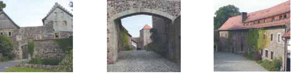
BURG FÜRSTENECK Akademie für berufliche und musisch-kulturelle Weiterbildung